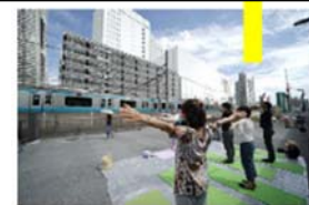
公共空間活用の手引き