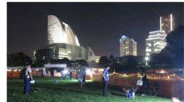
ナイトドッグラン(公共空間活用のモデル事業)

モデル事業の協議過程で民間事業者の皆様から「横浜市の公共空間は魅力的だが、手続きが煩雑でわかりにくい」という意見をいただいたこと等を踏まえ、許認可窓口の案内や手続きのフローお示しする手引きを策定。